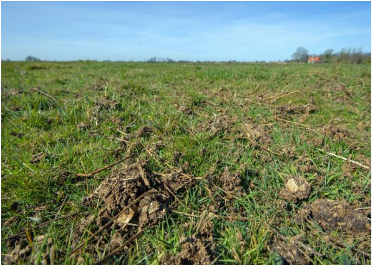
Ruige mest

Dit pakket is specifiek bedoeld voor boerenlandvogelbeheer en kan alleen in combinatie met andere, op broedvogels gerichte pakketten worden afgesloten. In pakketten t.b.v. bodemkwaliteit, water en klimaat is bemesting met ruige mest of andere bodemverbeteraars en plantenresten mogelijk via het pakket Bodemverbetering (pakket 39).