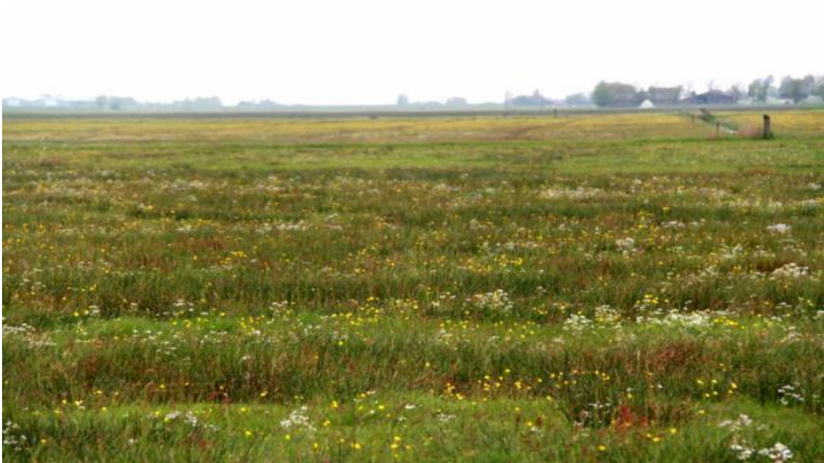
Kruidenrijk grasland

Op kruidenrijke graslanden komen de kruiden van nature in grotere aantallen voor en zijn verspreid over het hele perceel. De zode is open en divers van structuur door de vele kruiden met veel bloeistengels en weinig blad. Dit heeft ook als voordeel dat kuikens zich goed kunnen voortbewegen in het grasland.