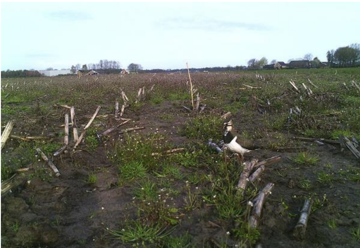
Kievit op bouwland met uitgesteld zaaien, fragment (foto https://boerin.files.wordpress.com/2016/05/bewegingscamera-bij-kievitsnest-1.jpg )

Contact met veldmedewerkers en/of vrijwilligers is erg belangrijk. Zij brengen de nesten en kuikens in kaart, waarbij zoveel mogelijk vanaf de rand van het perceel gemonitord wordt. Nesten worden geregistreerd, het liefst digitaal. Nesten worden beschermd tegen verstoring via verplaatsen, nestbeschermers of via uitstellen van zaaien van het gewas.