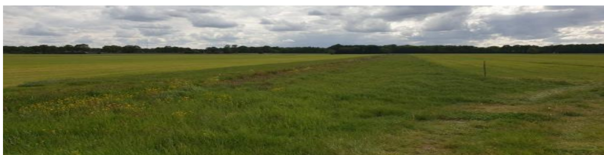
Kuikenveld: strook niet gemaaid gras

De vergoeding voor dit last-minute beheer met uitgesteld maaien begint te lopen vanaf 16 mei. Kuikenvelden worden bij voorkeur beheerd als vervolg op legselbeheer op grasland, registreer ze dan onder pakket 4 – Legselbeheer.