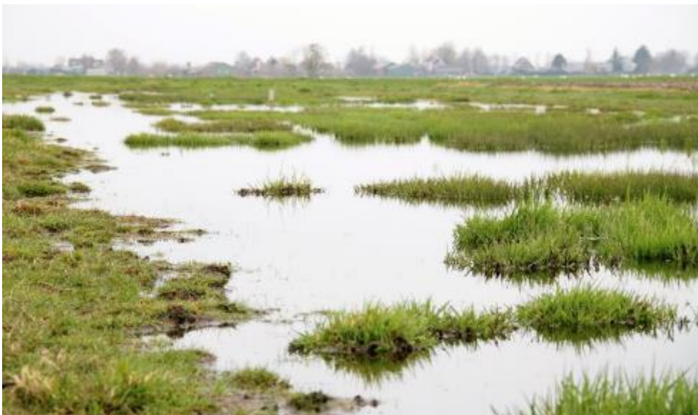
Plas dras in Krimpenerwaard (foto

Het pakket met startdatum 15 februari heeft als voordeel dat de plasdras aanwezig is bij de start van het weidevogelseizoen, het pakket met startdatum 1 maart biedt een langere tijd voor de ontwikkeling van de bodemfauna. De plasdrassen in de periode mei-augustus hebben een functie als opvethabitat voor de vogels. De plasdras in november-december is bedoeld voor overwinterende soorten zoals de Kleine zwaan.