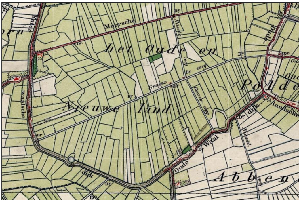
Afb. 5: Katerwaalsedijk en Oude Waaldijk omstreeks het jaar 1900.

Gezien de ligging van het beheermozaïek en het open karakter van de polder zijn er vooralsnog geen groene elementen die een belemmering vormen voor het weidevogelgebied. De opgaande beplanting aan de Katerwaalsedijk en Oude Waaldijk maken al een lange tijd onderdeel uit van het agrarisch landschap. In afbeelding 5 hieronder een kaart van omstreeks het jaar 1900.