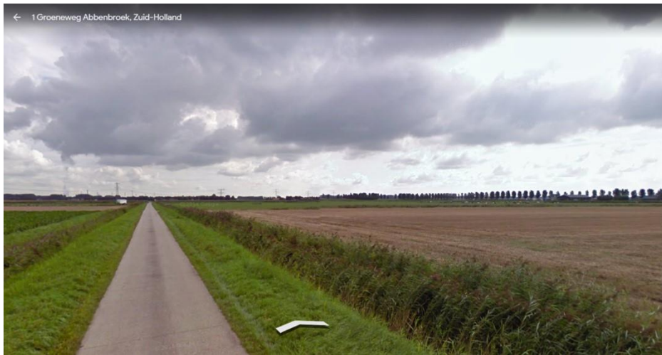
Afb. 3a: Locatie Groeneweg met zicht op het beheeremozaïek.

Een geschikt weidevogelbiotoop is een open gebied met zo min mogelijk (versturende) elementen waar predatoren van weidevogels gebruik van kunnen maken. Wat opvalt is dat polder Waalhoek-Abbenbroek over het geheel gezien open van karakter is.