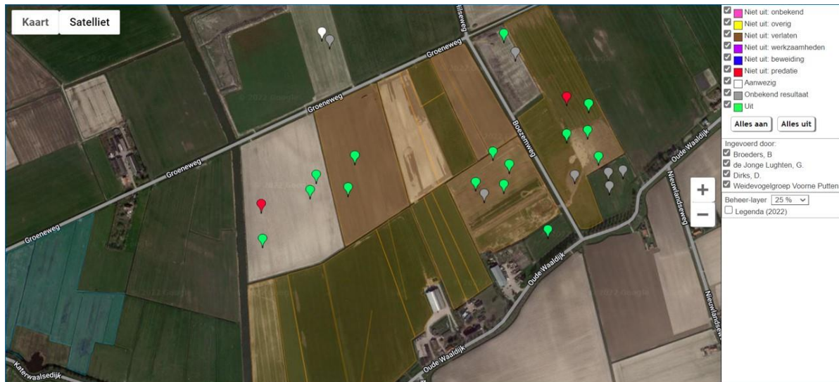
Afb. 6: Monitoring legfels in 2022 op percelen legselbeheer grasland en bouwland.

Het verminderen van kansen van predatoren kan een belangrijke bijdrage leveren aan succesvol weidevogelbeheer. Monitoring in het graslandreservaat van het Zuid-Hollands Landschap laat zien dat er vliegende predatoren worden waargenomen zoals kraai, buizerd en bruine kiekendief. Predatie op de agrarische percelen met legselbeheer lijkt mee te vallen. De meeste legfels zijn uitgekomen en twee legfels zijn vermoedelijk gepredeerd door een kraai of meeuw.