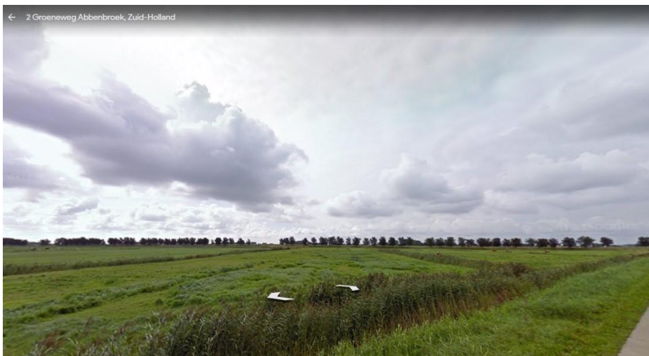
Afb. 3b: Locatie Groeneweg met zicht op graslandpercelen van het ZHL.